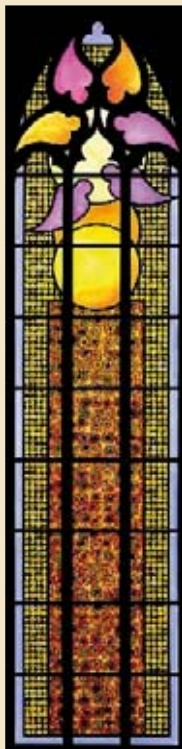
Kirchenfenster der Sankt- Sebastianus-Bruderschaft. Oberhalb der Schatzkammer in St. Nicolai