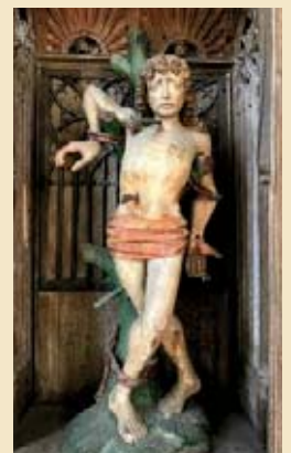
Sebastianusfigur in der Antoniuskirche Hanselaer

Aktive katholische Lebensführung, Eintreten für christliche Sitte und Kultur im privaten und öffentlichen Leben, Pflege von Brauchtum und Kalkarer Kunstgütern.