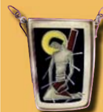
Brustschild der Stola des Fähnrichs bis 2017